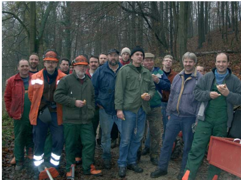
Bei der vielen Arbeit mundet ein deftiges Frühstück

Am 17. November um 9.00 Uhr war es dann endlich soweit. Mit Kettensägen und Freischneidern rückten etwa 30 tatkräftige freiwillige Helfer an. (Selbstverständlich alle aus Herberhausen und